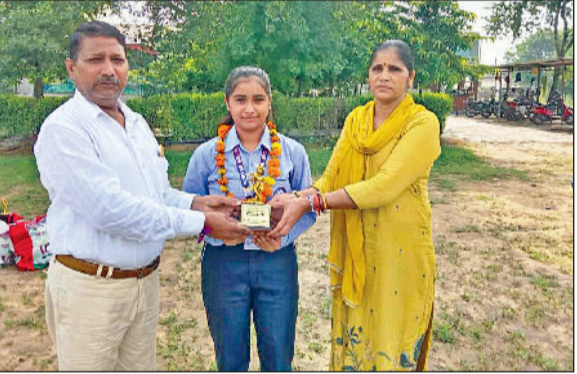
महेंद्रगढ़। छात्रा को सम्मानित करते हुए।

यह प्रतियोगिता 25 एवं 26 जुलाई को गोवा में आयोजित हुई थी। निकिता अपनी सफलता का