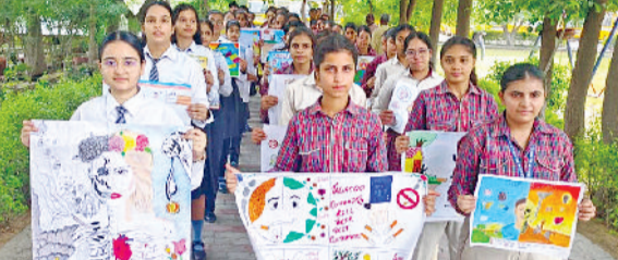
नारनौल। पोस्टर दिखाती छात्राएं।