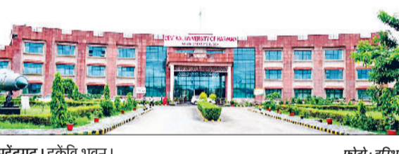
महेंद्रगढ़। हर्केवि भवन।

महेंद्रगढ़। हरियाणा केंद्रीय विश्वविद्यालय में शैक्षणिक सत्र 2025-26 के लिए जारी दाखिले की प्रक्रिया के अंतर्गत बीटेक पाठ्यक्रम में रिक्त सीटों पर दाखिले के लिए ओपन काउंसलिंग का आयोजन किया जा रहा है। ओपन काउंसलिंग में प्रतिभागिता के लिए पंजीकरण 23 अगस्त से शुरू होंगे। विश्वविद्यालय कुलपति प्रो.