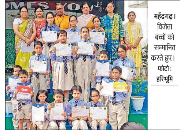
महेंद्रगढ़। विजेता बच्चों को सम्मानित करते हुए।