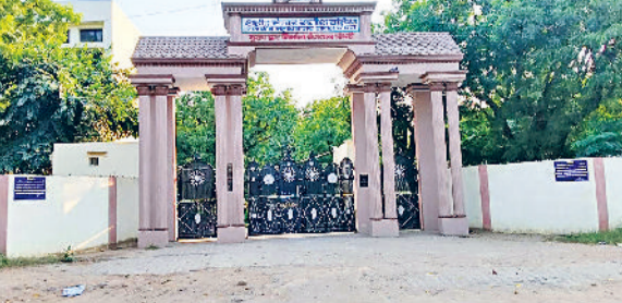
नांगल चौधरी। शहीद मेजर सतीश दहिया कॉलेज का प्रवेश द्वार।

अधिक विद्यार्थियों ने फीस जमा नहीं कराई है। सीटें खाली रहने से कॉलेज प्रशासन को पढ़ाई सुचारू रूप से चलाने में असुविधा हो रही है। आपको बता दें कि नांगल चौधरी में विद्यार्थियों की उच्च शिक्षा के लिए दो कॉलेजों की सुविधा उपलब्ध है। 12 कक्षा कक्षा की परीक्षा का