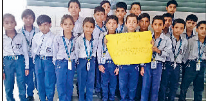
महेन्द्रगढ़ कार्यक्रम में उपस्थित विद्यार्थी।