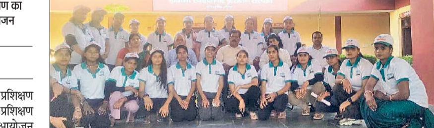
नारनौल। ब्यूटी पार्लर प्रशिक्षण लेने वाले प्रशिक्षणार्थी।

पंजाब नेशनल बैंक ग्रामीण स्वरोजगार प्रशिक्षण संस्थान नसीबपुर में चल रहे ब्यूटी पार्लर प्रशिक्षण का वीरवार को समापन कार्यक्रम का आयोजन किया। इस अवसर पर संस्थान के निदेशक एचआर सभरवाल ने प्रशिक्षणार्थियों को समय का महत्व समझाते हुए समय प्रबंधन पर जोर दिया। उन्होंने प्रशिक्षणार्थियों को प्रोत्साहित करते हुए कहा कि किसी भी कार्यक्षेत्र के साथ यदि आपका भावनात्मक लगाव है, तो इसमें कोई अतिशयोक्ति नहीं कि उस क्षेत्र में आपको सफलता की प्राप्ति न हो। इसलिए जिस भावना से आप यहां प्रशिक्षण लेने के लिए आए हो उसी मनोभाव से आपको प्रशिक्षण लेकर तथा उसे अपने व्यवसाय के रूप में स्थापित करें। संस्थान के निदेशक ने बताया कि