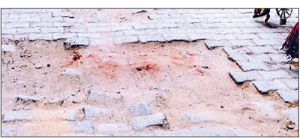
महेन्द्रगढ़। जर्जर अवस्था में स्टेट हाईवे की जाने वाला मार्ग।

किलोमीटर मार्ग पर अनेक मोहल्ले पड़ते हैं। शहर को जोड़ने के लिए मौहल्ला सराय रोड, मोहल्ला सुनारों का, मोहल्ला धानकान, सराय खटीकान होते हुए 148-बी स्टेट हाईवे को जोड़ने वाला यह सुगम मार्ग है। इसका निर्माण पूरा होने के बाद शहर पर यातायात का भार भी कम हो जाएगा। इस बहाल मार्ग पर बरसात के समय में गड्ढों में पानी भरने के कारण लोगों की परेशानी बढ़ जाती है। साथ ही लोगों द्वारा किए गए अतिक्रमण के कारण सड़क संकरा हो गया गया। अब नपा की ओर से अतिक्रमण हटाने के साथ-साथ इसकी चौड़ाई को भी बढ़ाया जाएगा। इस मार्ग पर राजकीय महाविद्यालय, महिला कॉलेज, लघुसचिवालय, न्यायिक परिसर सहित मिस्त्री व अन्य मार्केट स्थित है। चार महीने बाद इस मार्ग का निर्माण को पूरा करने का लक्ष्य रखा गया है।