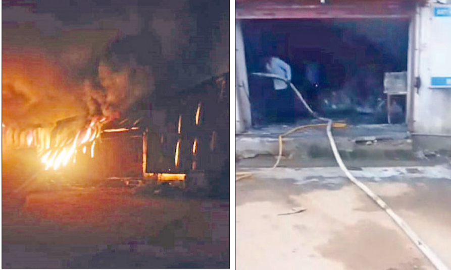
नारनौल। फैक्ट्री में लगी आग व सुबह आग बुझाता फायर ब्रिगेड कर्मचारी।

फैक्ट्री के साथ साथ एजेंसी में रखा सामान भी जल गया। आगे लगने की सूचना मिलने पर फायर ब्रिगेड की 12 गाड़ियां व 10 पानी के टैंकर्स आग बुझाने में जुटे हुए हैं। जानकारी के अनुसार यह घटना बुधवार व वीरवार रात करीब दो बजे की है। मिली जानकारी के अनुसार निजामपुर रोड पर फ्लाईओवर से आगे जेरासी गांव की ओर बंसल